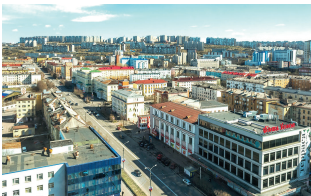
Вид Октябрьского административного округа

Октябрьский округ является центральным в городе Мурманске. В округе проживает более 90 тысяч жителей. В Октябрьское отделение обращаются не только жители округа, но и те, кто работает или учится в этом районе, а также гости нашего города.