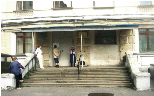
Площадь отделения составляет 443,4 кв.м.

Ранее в данном помещении располагалась Учетно-расчетная служба № 4.