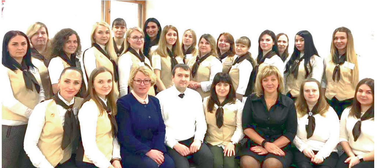
Коллектив Отделения по Октябрьскому административному округу 2019 год

В 2019 году отделение приняло участие в мероприятиях в рамках проекта популяризации Портала госуслуг в библиотеках Мурманска. Специалисты знакомили граждан с функциональными возможностями портала, рассказали о порядке получения услуг в электронном виде.