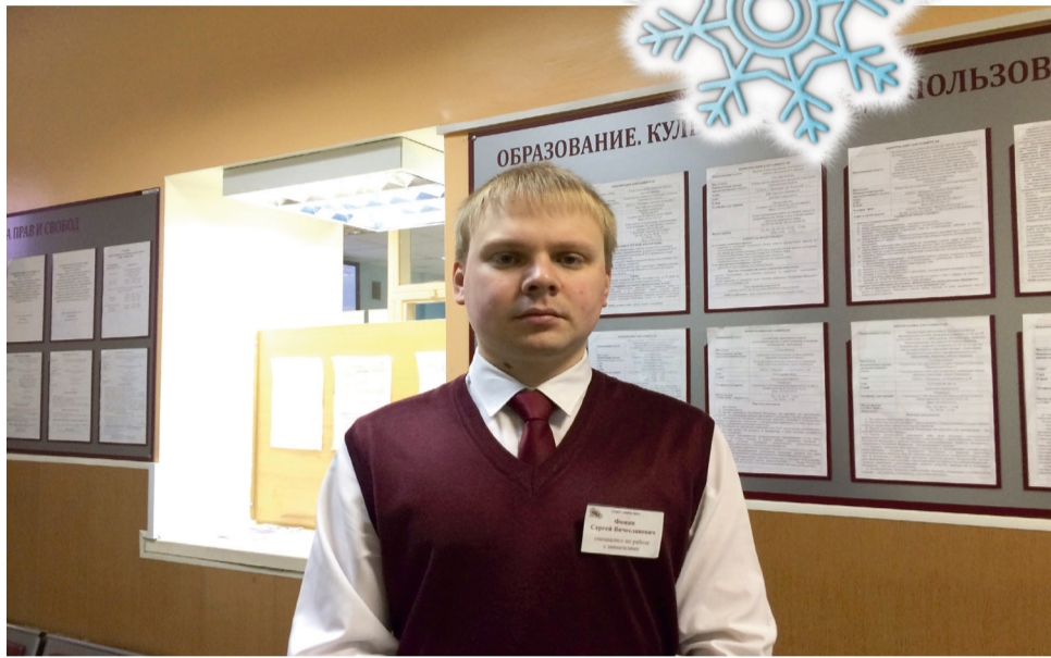
Победители регионального этапа представлены для участия во Всероссийском конкурсе «Лучший многофункциональный центр России» в номинации «Лучший МФЦ» и «Лучший универсальный специалист МФЦ».